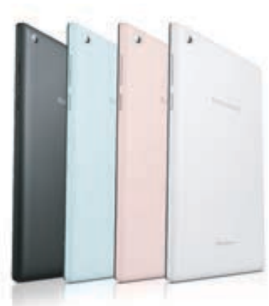
Lenovo® Tab 2 A7-30

Tablet, Cestovní napájecí adaptér, USB kabel, Informace o záruce, Uživatelská příručka