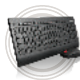
Lenovo™ Ultratenký set bezdrátové klávesnice a myši