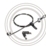
Kensington® MicroSaver® bezpečnostní kabel od společnosti Lenovo™