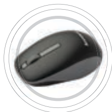
N100 bezdrátová myš