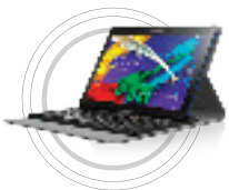
A10 Folio Keyboard Case