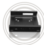
ThinkCentre Tiny VESA® Mount držák Flexibilní a prostorově úsporný