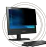
3M Monitor fólie Antireflexní fólie na displej