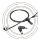
Kensington® MicroSaver® bezpečnostní zámek kabelu od Lenovo Ochrana proti krádeži