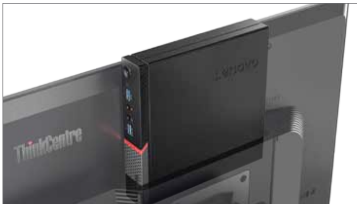
ThinkCentre® M700 Thin Client propojený s ThinkCentre® Tiny-in-One