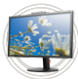
ThinkVision® řada T Multimediální řada