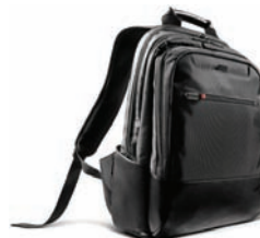
43R2482 ThinkPad Business Backpack