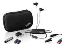
0B47313 ThinkPad Noise-Cancelling Earbuds

Lenovo si vyhrazuje právo kdykoliv měnit nabídku produktů nebo specifikací bez předchozího upozornění. Lenovo vynakládá veškeré úsilí, aby zajistilo přesnost všech informací, ale není odpovědné za redakční, fotografické nebo typografické chyby. Obrázky jsou pouze ilustrační. Úplné specifikace produktů Lenovo najdete na www.lenovo.com . Lenovo nezastupuje ani negarantuje jakékoliv produkty či služby třetích stran. Veškeré podrobnosti o úspoře času a nákladů a tvzení TCO najdete na www.lenovo.com/save . Jako partner Energy Star se Lenovo zavázalo, že takto označené nebo popsane produkty splňují příslušné směrnice Energy Star pro energetickou účinnost. EPEAT je systém, který pomáhá kupujícím rozhodnout, porovnávat nebo vybírat počítačové produkty na základě ekologických atributů. OCHRANNÉ ZNÁMKY: Lenovo, Lenovo logo, New World New Thinking, ThinkPad, ThinkVantage, UltraNav, TrackPoint, ThinkPlus a Access Connections jsou ochranné známky Lenovo. Intel a Core jsou ochranné známky společnosti Intel Corporation v USA a dalších zemích. Microsoft, Windows a Life Without Walls jsou ochranné známky společnosti Microsoft Corporations v USA a dalších zemích. Další názvy firem, produktů a služeb mohou být ochranné známky nebo známky služeb jiných firem. ©2013 Lenovo. Všechna práva vyhrazena. Nejnovější informace o bezpečné a efektivní práci na počítači najdete na lenovo.com/safecomputing